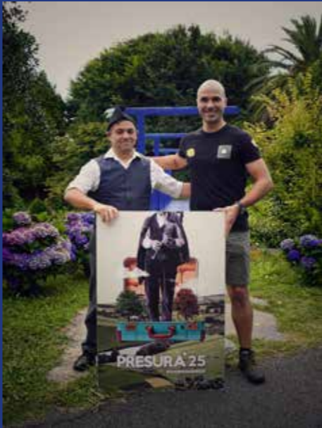
NO SOLO JARDINES