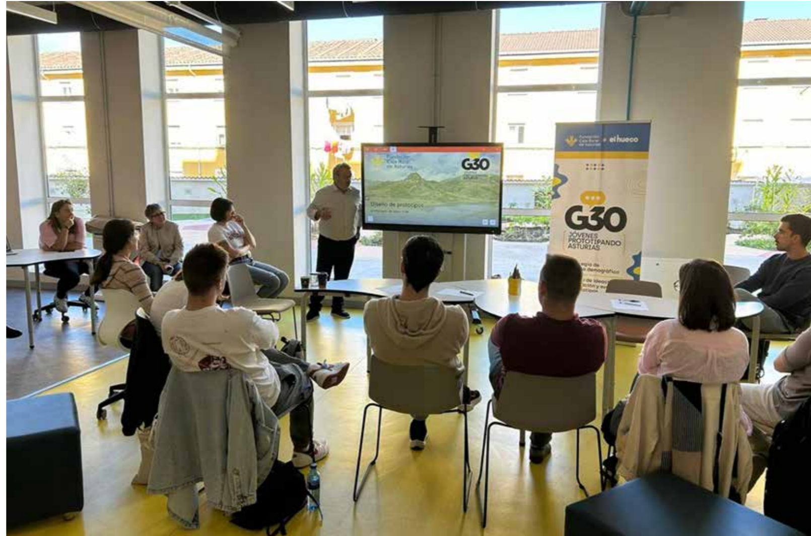
FOTO UNA DE LAS SESIONES DEL G30 CELEBRADA EN LAS INSTALACIONES DE ARKUO, EN LANGREO.

El cuarto piloto, Axuntando, nace del área de bienestar y propone la creación de espacios de acompañamiento comunitario en zonas rurales. Estos círculos de encuentro trabajarán temas como el autocuidado, la identidad o las relaciones, ofreciendo un entorno seguro para compartir experiencias y emociones. Su primera fase se desarrollará en los municipios de la mancomunidad de las Cinco Villas (Muros del Nalón, Pravia y Soto del Barco), con el objetivo de fortalecer vínculos, mejorar el bienestar emocional y reforzar el sentido de pertenencia.