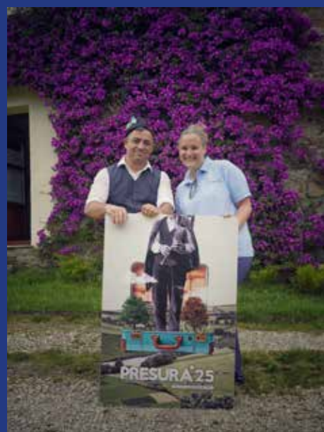
FINCA EL RIBEIRO