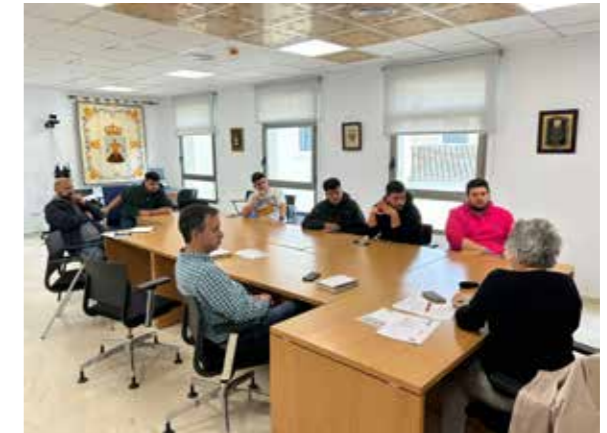
FOTO SESIÓN DE TRABAJO CELEBRADA EN ALEDO.

Ese mapa está siendo integrado en una página web interactiva que ya se encuentra en construcción. Se trata de un espacio vivo, concebido para evolucionar a lo largo del proyecto, que albergará información en distintos formatos multimedia: audios, vídeos, fotografías y testimonios. La web será, además, una ventana de acceso para nómadas digitales y nuevos pobladores interesados en descubrir y vivir la experiencia rural desde una perspectiva contemporánea.