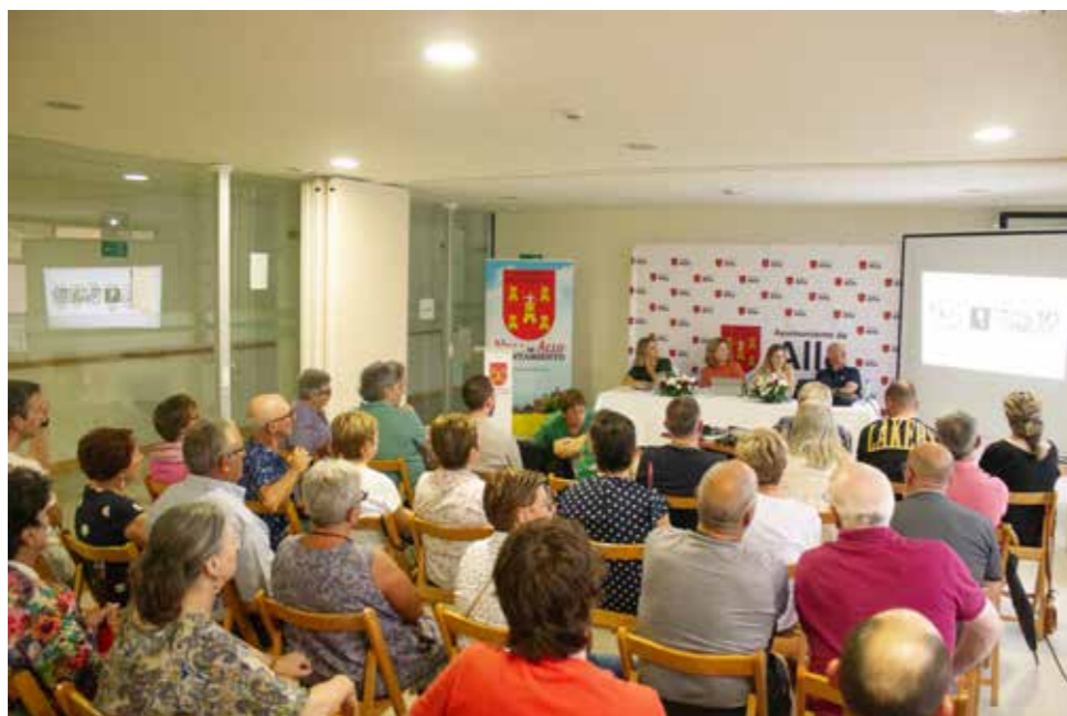
FOTOS IMÁGENES DE LA JORNADA CON EXPERTOS CELEBRADO EN ALLO EL PASADO MES DE FEBRERO.