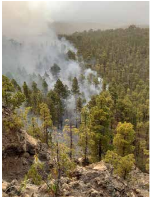
FOTO INCENDIO FORESTAL EN LA ISLA DE TENERIFE

Durante cien siglos los habitantes de la península ibérica han presionado sobre la cubierta vegetal extrayendo de ella, directa o indirectamente, una parte muy grande de su producción. Los montes españoles, llueva mucho o poco, han producido, producen, y van a seguir produciendo materia vegetal, leñosa y no leñosa... Y esa materia vegetal se puede entender como naturaleza y diversidad, pero también se puede entender como alimento y combustible. Durante cien siglos la producción anual de nuestros montes la hemos quemado como leña y nuestros animales se la han comido como alimento. Y la vegetación ha resistido. Ha resistido el diente del animal y el hacha del paisano. Ha resistido las quemadas controladas e incontroladas para aclarar monte. Ha resistido las suertes de madera huroneada para salvar el invierno. Ha resistido y se ha acostumbrado a convivir con la explotación ordenada y no ordenada. Se ha vuelto resiliente al diente y al hacha.