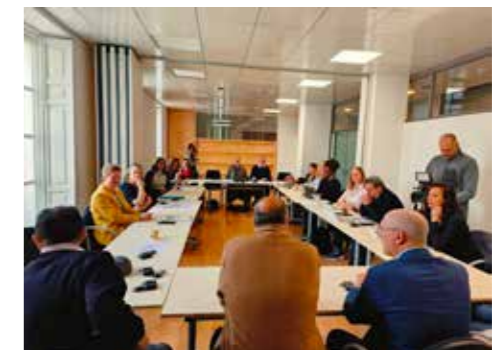
FOTOS IMÁGENES DE LA REUNIÓN PRESENCIAL CELEBRADA EN CUENCA, CON LA ASISTENCIA DEL VICEPRESIDENTE DE LA JUNTA DE CASTILLA-LA MANCHA, JOSÉ LUIS MARTÍNEZ GUIJARRO.