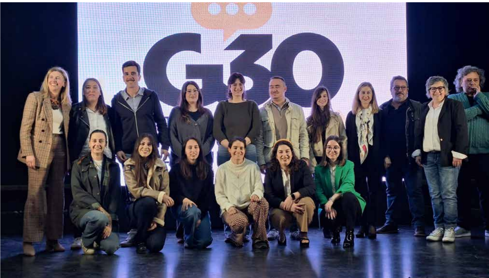
FOTO FOTO DE FAMILIA EN EL ACTO DE PRESENTACIÓN DE LOS PROYECTOS EN LA BENÉFICA DE PILOÑA, EL PASADO MES DE MARZO.

El proyecto G30 Jóvenes Prototipando Asturias , impulsado y financiado por la Fundación Caja Rural de Asturias, concluye tras once meses de trabajo con un logro tangible: el diseño de cuatro proyectos piloto que abordan retos clave del medio rural. Las iniciativas, que van desde la gestión sostenible de residuos hasta la movilidad o el bienestar comunitario, serán implementadas en los próximos meses gracias al compromiso de la Fundación, que acompaña a los jóvenes en esta fase decisiva de transformación territorial.