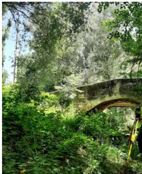
FOTO ZONA RURAL EN LAS PROXIMIDADES DEL RÍO GARIGAY, EN GUADALAJARA