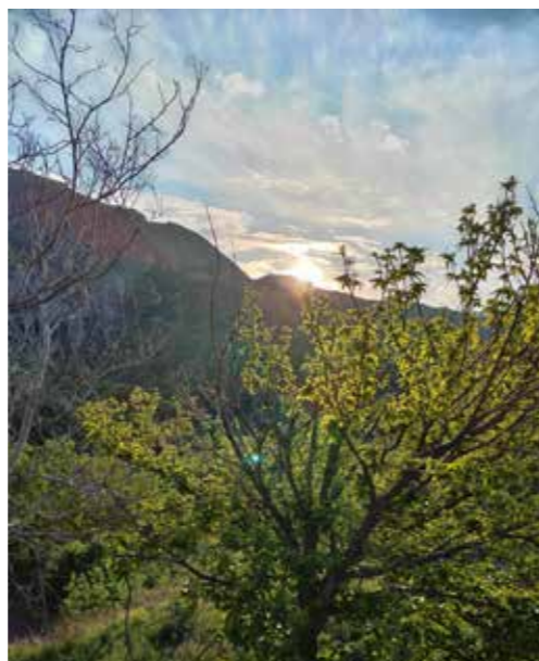
FOTO PAISAJE DE LA COMARCA DE EL BIERZO, EN LEÓN

LOS CAMPOS ESPAÑOLES HAN VIVIDO ESTE AÑO UN VERANO ATROZ DE INCENDIOS FORESTALES. UN VERANO ATROZ QUE, ADEMÁS, SE HA CEBADO ESPECIALMENTE EN LOS ESCENARIOS MÁGICOS DE LO MÁS VACÍO DE LA ESPAÑA VACÍA. AUNQUE LA REFLEXIÓN EN CALIENTE NUNCA ES BUENA CONSEJERA ES IMPOSIBLE EVITARLA. HARÉ UN ESFUERZO, ESO SÍ, POR MOVERME DENTRO DE LOS MÁRGENES DE LA ESTRECHA LÍNEA QUE SEPARA A LA RAZÓN DEL RUIDO Y LA FURIA.