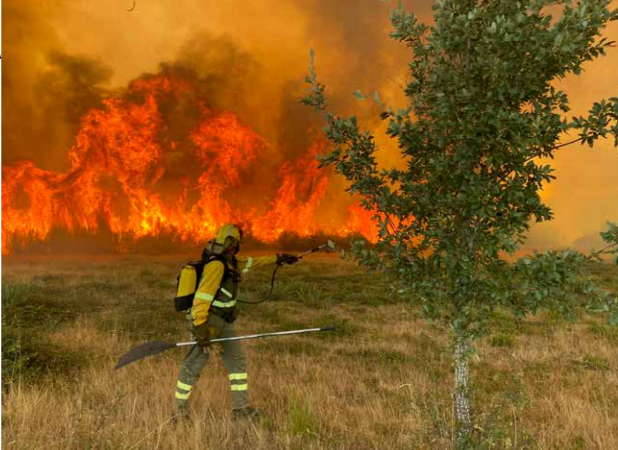
FOTO LABORES DE EXTINCIÓN EN UN INCENDIO FORESTAL

Ver viejas fotografías de la España interior es ver un espacio esquilado, prácticamente yermo, por donde parece cruzar errante la sombra de Caín, como dijo el poeta.