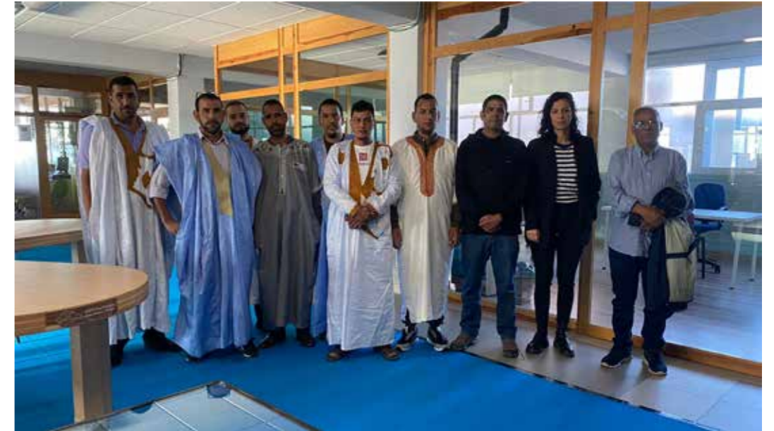
FOTO VISITA DE UNA DELEGACIÓN SAHARAUI A EL HUECO (SORIA) PARA CONOCER EL PROYECTO HIJOS DE LAS NUBES.

La dimensión social del proyecto fue notable. En un municipio de apenas 450 habitantes, la creación de un empleo ligado al cuidado del monte supuso un paso adelante. Además, el rebaño se convirtió en símbolo de orgullo local y de la capacidad de reinventar oficios en riesgo de desaparecer. La prensa nacional recogió la experiencia como ejemplo de cómo la innovación rural puede apoyarse en tradiciones milenarias y, al mismo tiempo, proyectar una imagen moderna y resiliente del mundo rural.