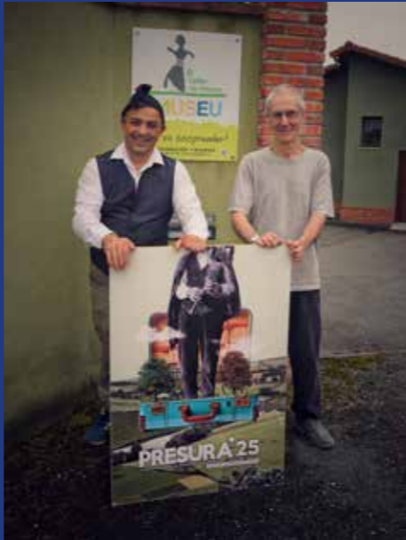
MUSEO DE TITERES