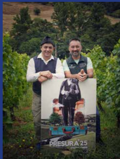
BODEGAS MARTÍNEZ PARRONDO