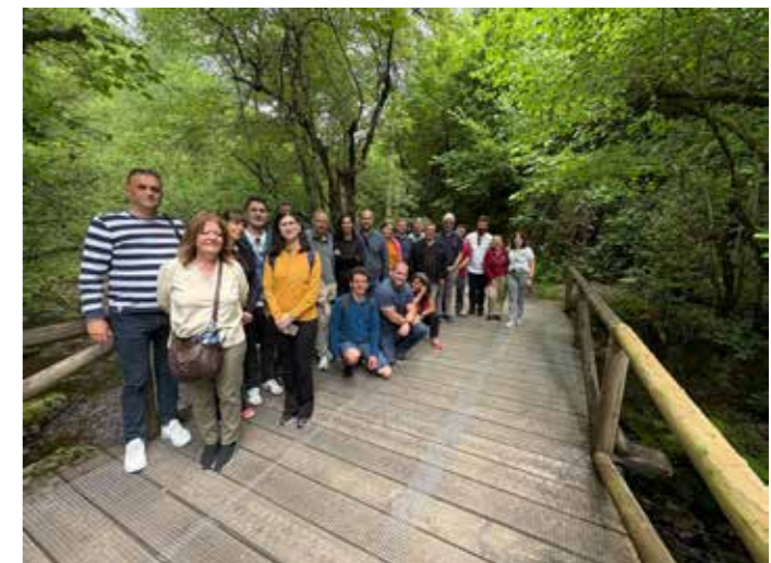
FOTO FOTO DE GRUPO DE LA REUNIÓN DE LANZAMIENTO DEL PROYECTO SIJMA EN LA RESERVA DE LA BIOSFERA EN MUNIELLOS.