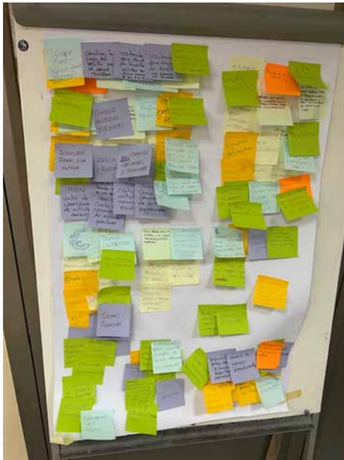
FOTO LLUVIA DE IDEAS EN UNA DE LAS SESIONES DE TRABAJO DEL PROYECTO ENJOY RURAL WORKING.

Enjoy Rural Working es un proyecto que apuesta por la innovación rural. Aledo y Caleruega están elaborando su mapa de recursos y creando una página web interactiva que incluirá contenidos multimedia. Además, cada municipio desarrollará un producto tecnológico propio que servirá como escaparate de su patrimonio y motor de atracción para nómadas digitales, nuevos pobladores y visitantes.