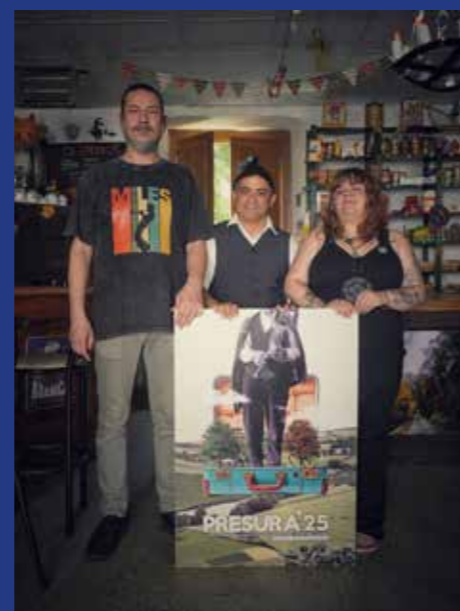
LA BRUXA DE MUNIELLOS