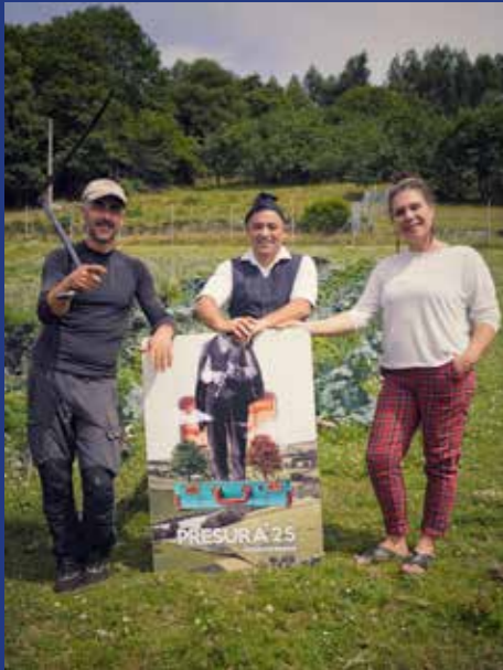
PITA FESTA - ACOUGO PITA SANA