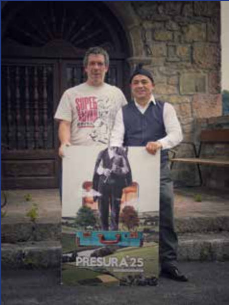
MONCHO MORANDEIRA JOYAS