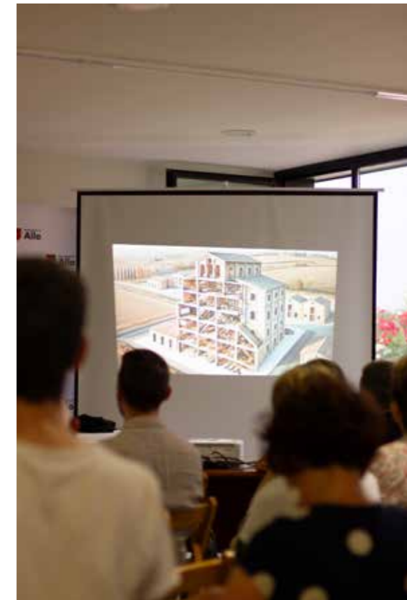
Un edificio histórico rehabilitado con participación ciudadana y apoyo institucional en Navarra