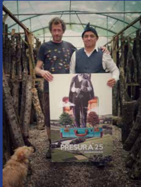
SETAS DE BOSQUE