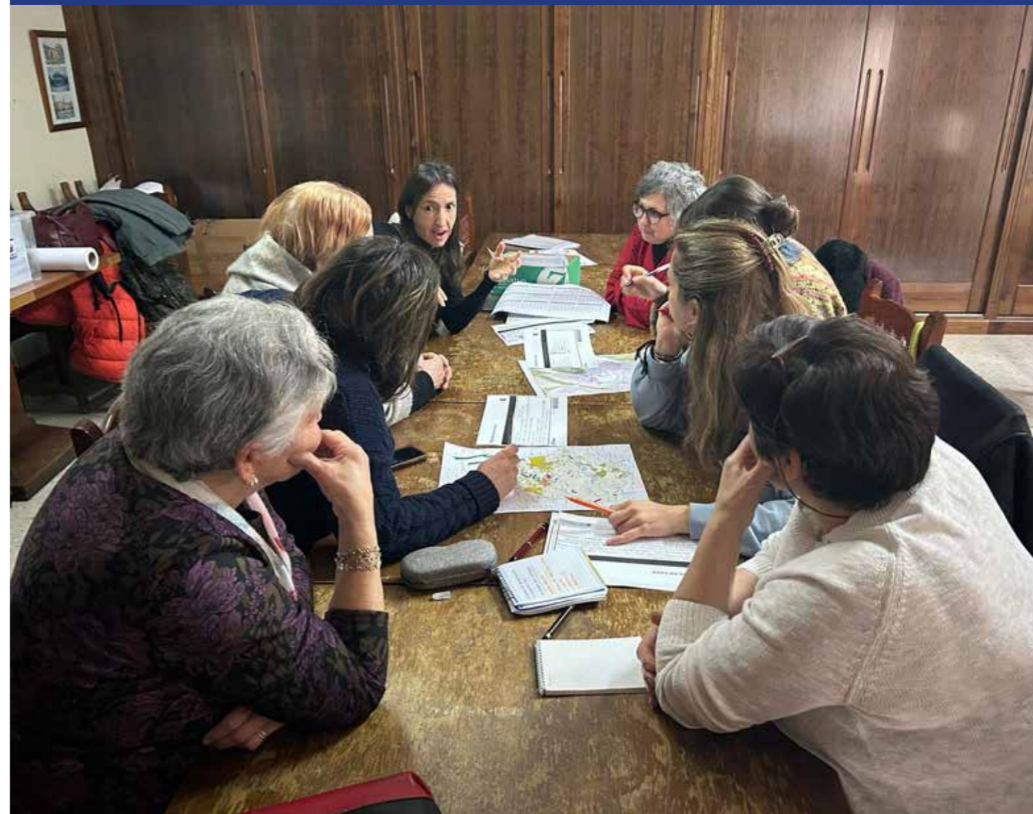
FOTO SESIÓN DE TRABAJO CELEBRADA EN CALERUEGA.