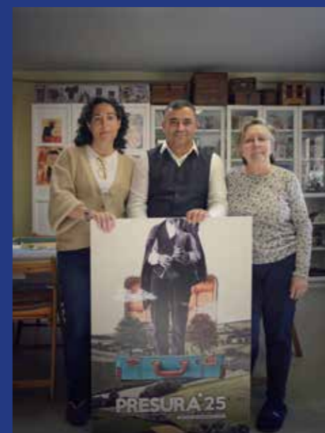
LA TIERRONA CREATIVA