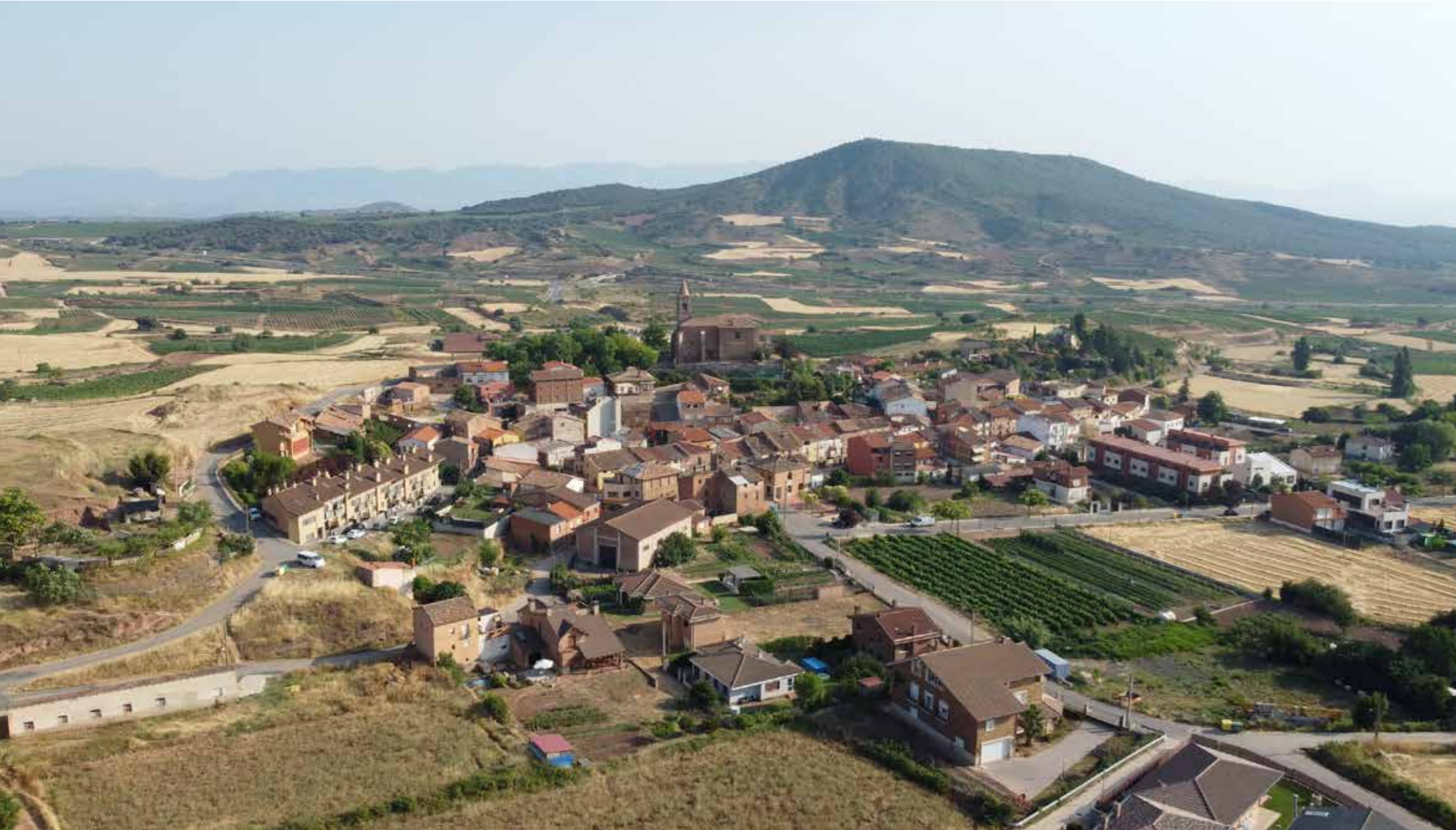
FOTO VENTOSA A VISTA DE DRON